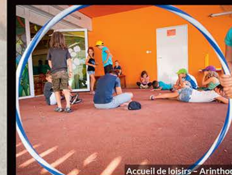
Accueil de loisirs - Arinthod