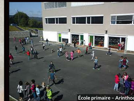
École primaire - Arinthod