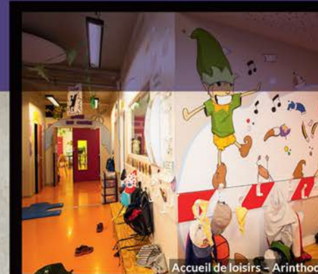
Accueil de loisirs - Arinthod